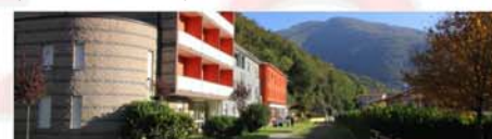
R.S.A. "Madre Teresa di Calcutta" (Sarezzo - BS)