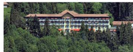
R.S.A. "Eremo di Miazzina" (Gravellona Toce - VB)