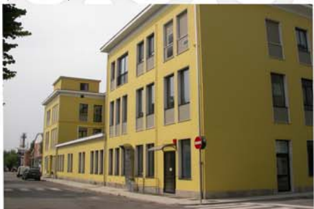
Palazzo Giallo Istituto Zooprofilattico Sp. (Brescia)