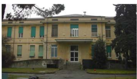
Ospedale "S. Spirito" (Casale Monferrato - AL)