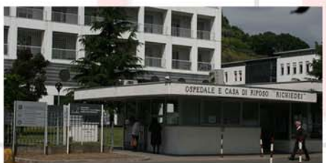
Ospedale e R.S.A. "Richiedei" (Gussago - BS)