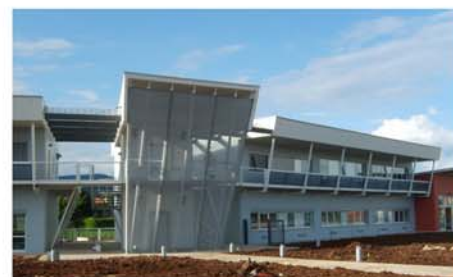
R.S.A. "Itaca" (Mazzano - BS)