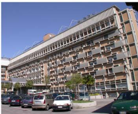
Ospedale "Civile" di Pordenone (Pordenone)