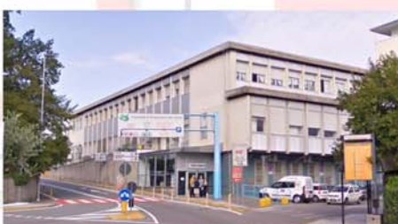
Ospedale di Desenzano del Garda (Desenzano del Garda - BS)