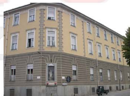
R.S.A. "I.P.A.B. D. Bertone" (Bagnolo Piemonte- CN)