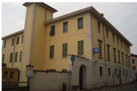
Ospedale "Santa Corona" (Gardone Riviera - BS)