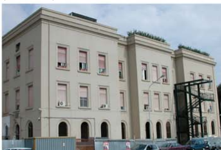
Ospedale "Civico" di Palermo (Palermo)