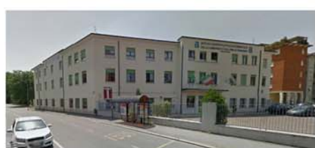
Palazzo Grigio Istituto Zooprofilattico Sp. (Brescia)