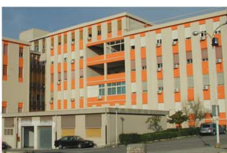
Ospedale "Trigona" di Noto (Noto - SR)